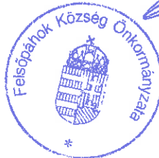
Prótár Richárd Krisztián Polgármester