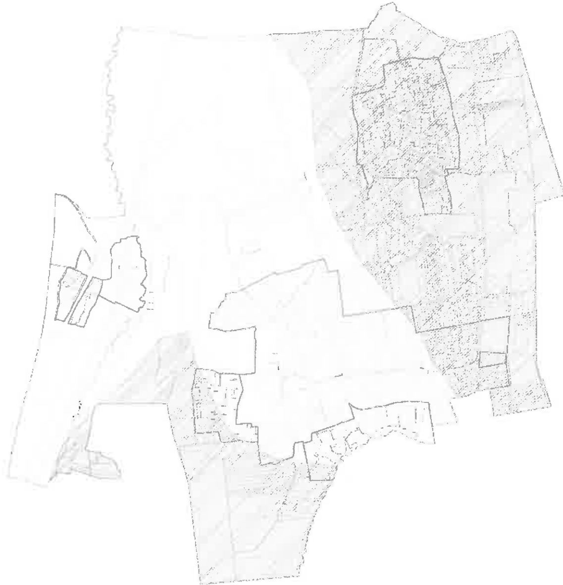
3. Tájképvédelmi szempontból kiemelten kezelendő területek (Balaton-felvidéki Nemzeti Park adatszolgáltatása alapján)