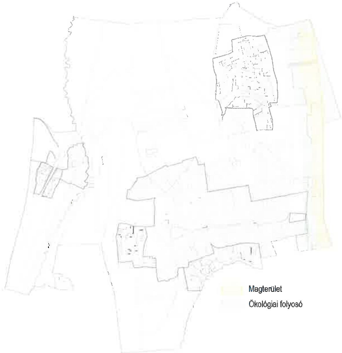
2. Országos ökológiai hálózat elemei (Balaton-felvidéki Nemzeti Park adatszolgáltatása alapján)