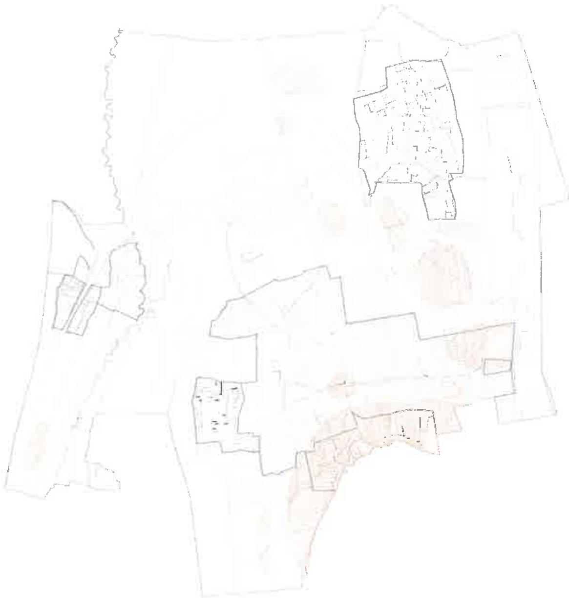
1. Régészeti lelőhelyek