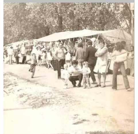
A Dózsa György utca egy részlete az 1970-es évek közepén és 2008-ban. Köszönet a Hegyi családnak!