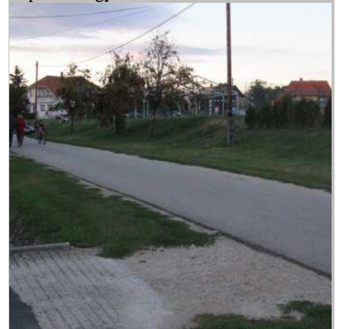
További régi képek találhatóak a faluról a www.felsopahok.hu honlapon, ahova szeretettel várjuk az Önök archív felvételeit is!