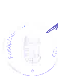
Prótár Richárd Krisztián polgármester