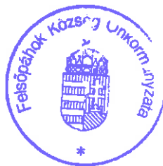
Prótár Richárd Krisztián polgármester